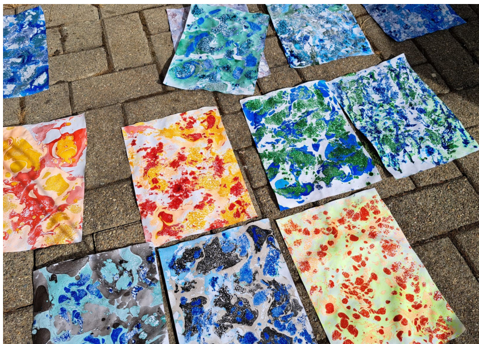
Selbstgestaltete Buchdeckel für das Erinnerungsbuch der bald Konfirmierten