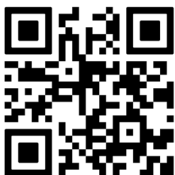
Einsatzplan Foodsave Bankett